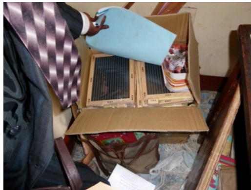
Alles voor school wordt eind van de dag opgeborgen in tassen en dozen

De Fonteinkerk in Amersfoort is in 2009 een actie gestart om geld bijeen te brengen voor de leermiddelen in de school in het kindertehuis te Kinkole. Met diverse acties als bloembollen-, kaarsen- en koekverkoop en een vaste bestemming voor de avondmaalscollecte is een bedrag van ruim €2.000,- opgebracht. Dit zal worden bestemd voor de afbouw van het schoolgebouw en kasten voor de leermiddelen.