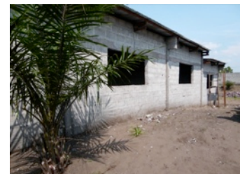
Het nieuwe schoolgebouw heeft nog geen deuren en ramen met tralies.